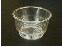
S931 Coupe dessert à pied cristal - Colis de 24 lots de 25 Ref. S931PS17ANEU - 79.51 EUR