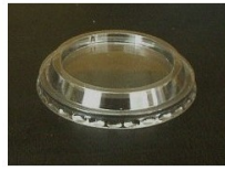
C931 Couvercle pour coupe à dessert à pied - Colis de 24 lots de 25 Ref. C931PVC7ANEU - 38.80 EUR